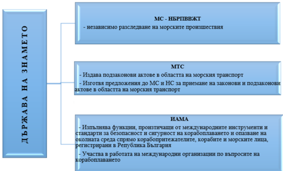
Фигура 2. Държава на знамето

Основно задължение на компетентния орган е да осигури стриктно спазване на установените норми и стандарти в тези инструменти и националното законодателство, от корабите, плаващи под българско знаме и лицата, попадащи в обхвата на инструментите.